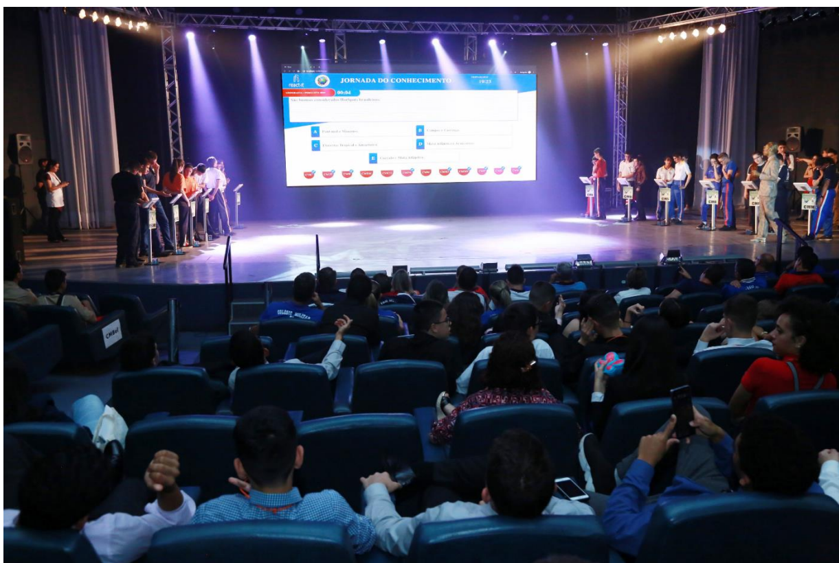
Figura 7 - Imagem com destaque para a forma de apresentação de questão do software em telão central.