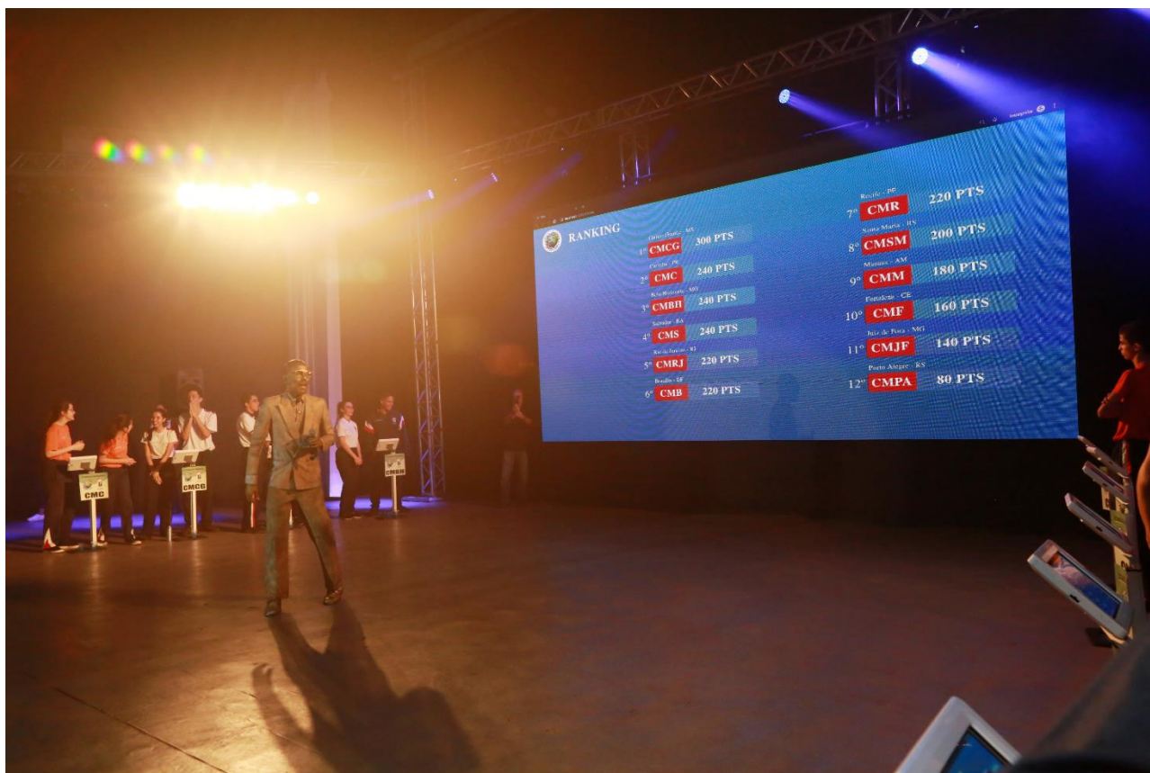
Figura 8 - Imagem demonstrando Ranking disponibilizado pelo Software.