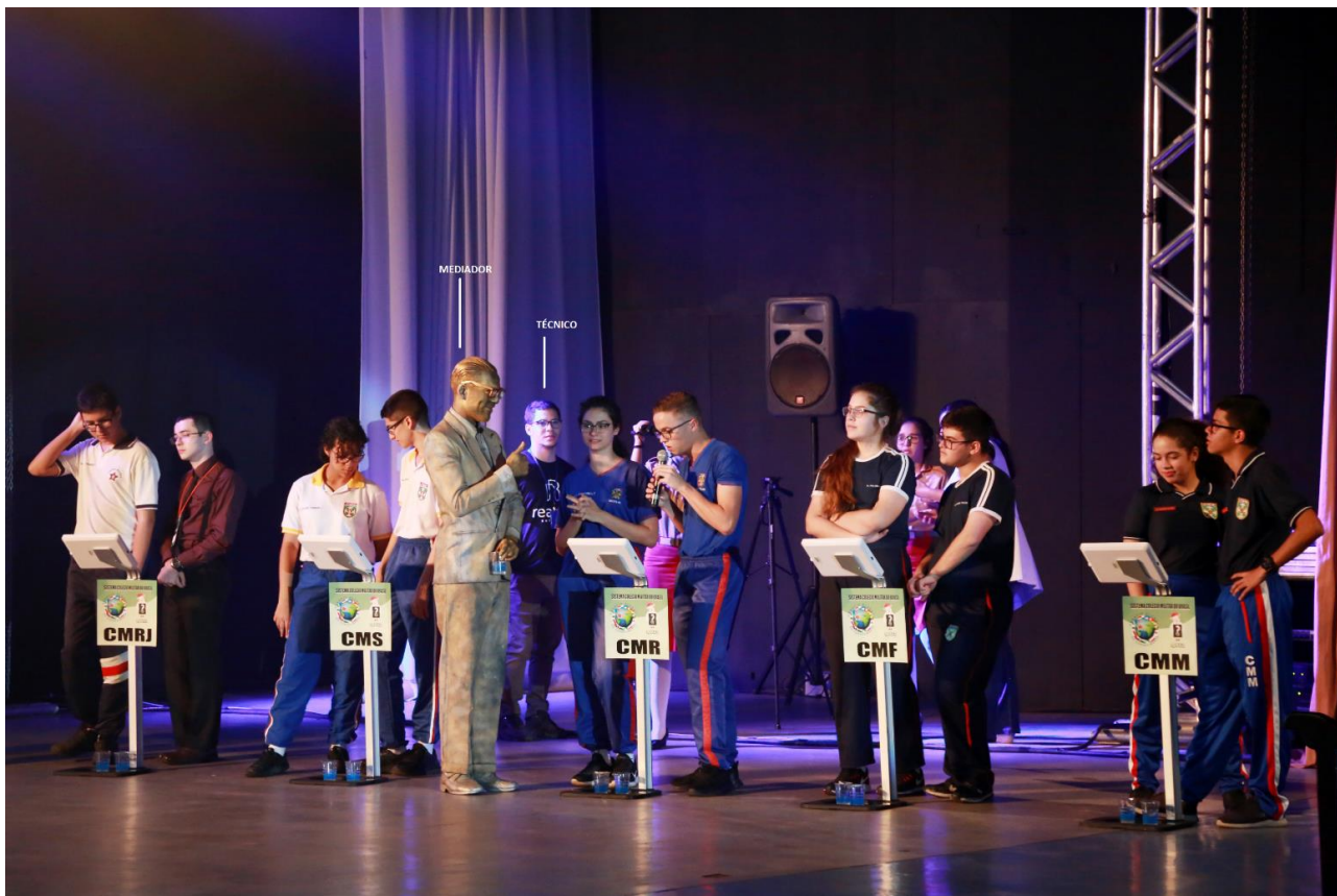
Figura 6- Imagem com destaque para parte do recurso humano disponibilizado.