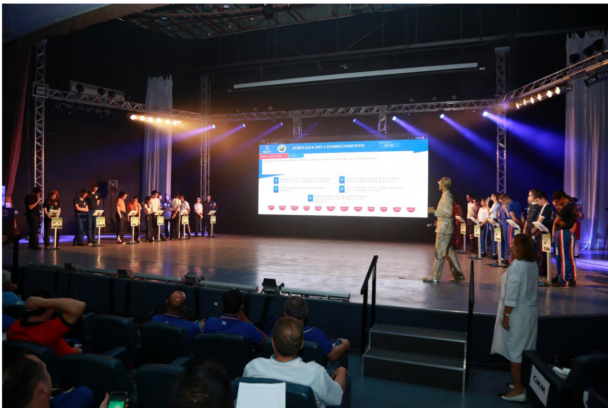
Figura 1 - Imagem do Dispositivo Geral do Quiz.