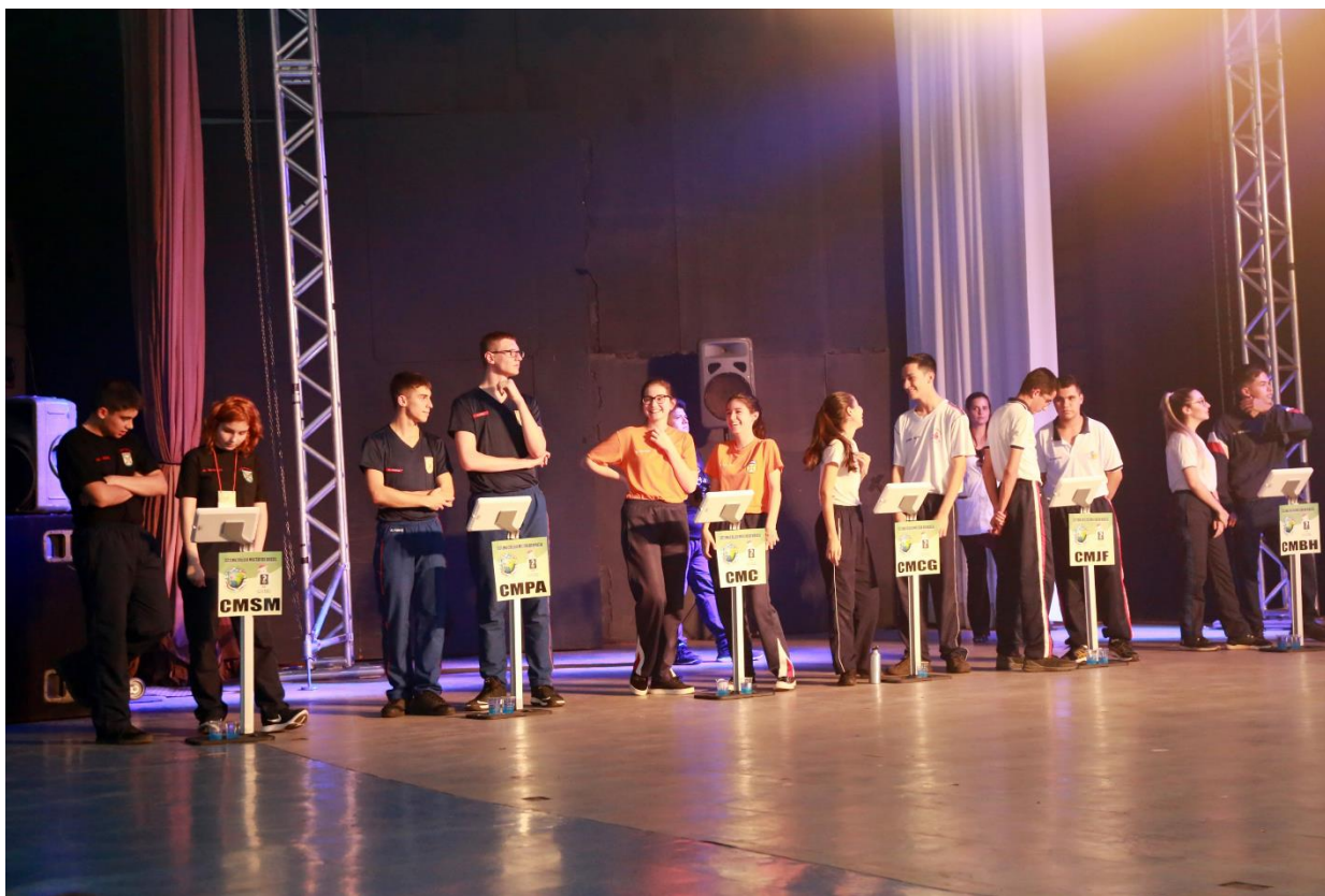
Figura 2 – Imagem com os Equipamentos Disponibilizados: Tablets, Suportes p/ Tablets, Placas de Identificação dos Colégios.