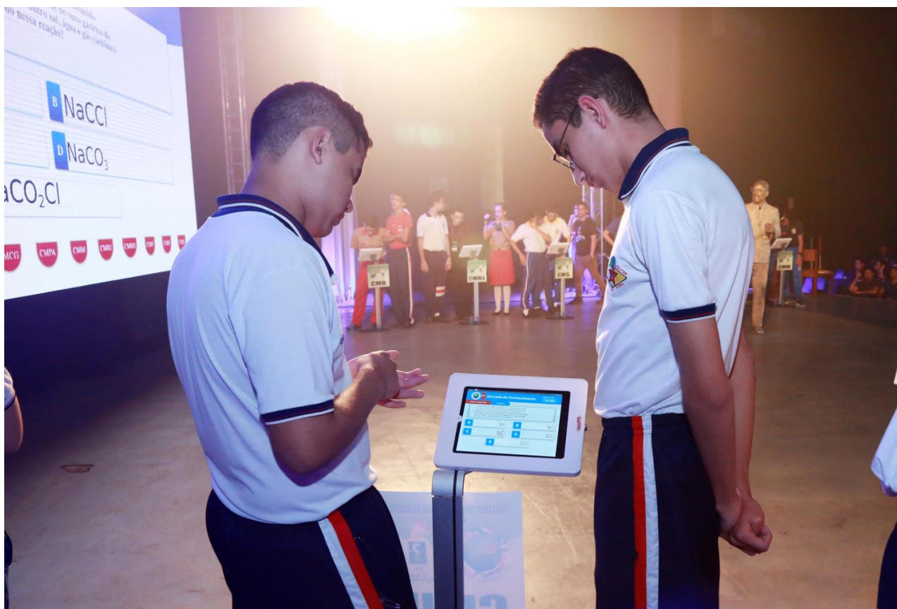
Figura 5 - Imagem com destaque para o uso do tablet por equipe.