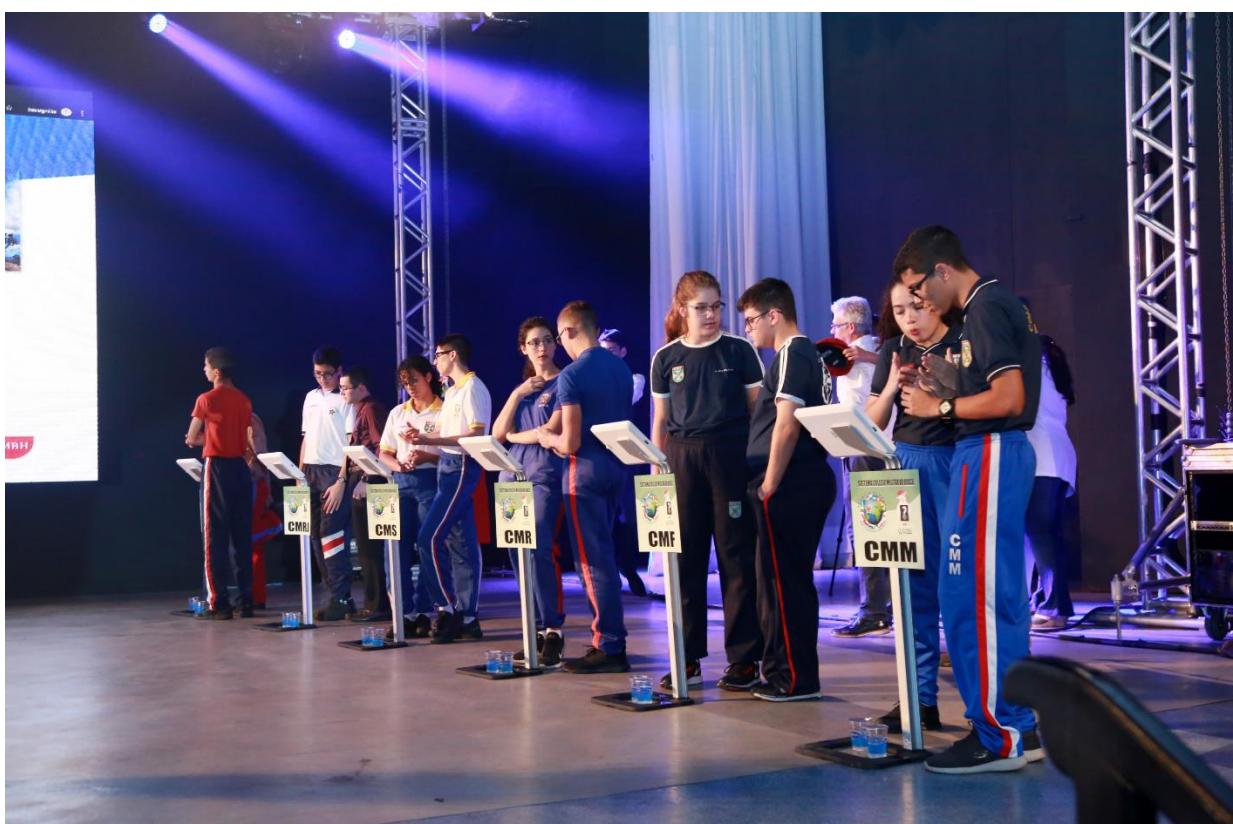
Figura 3- Imagem com outra linha de equipes.